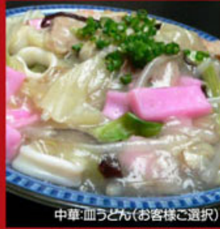
中華:皿うどん(お客様ご選択)