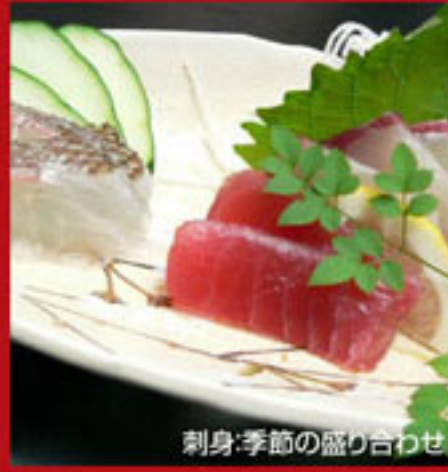
刺身:季節の盛り合わせ