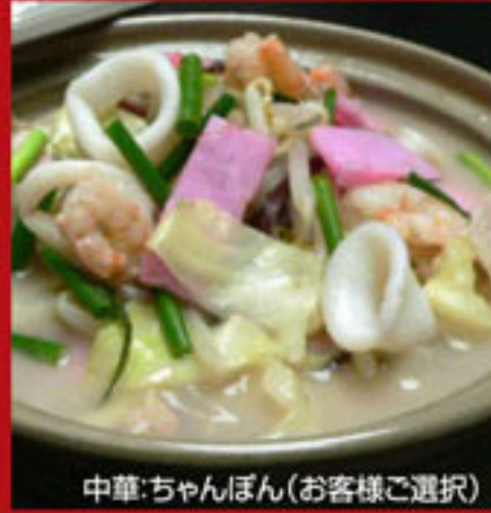
中華:ちゃんぽん(お客様ご選択)