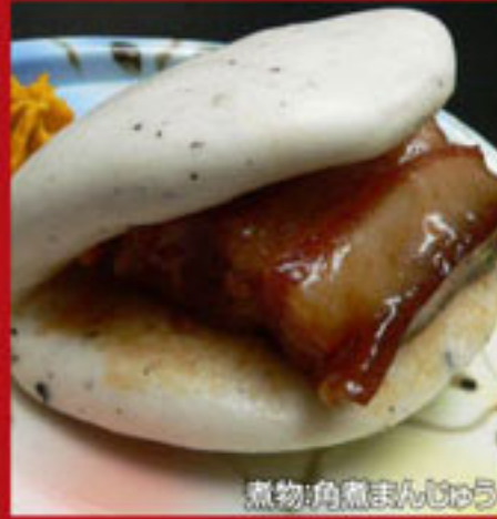
煮物:角煮まんじゅう