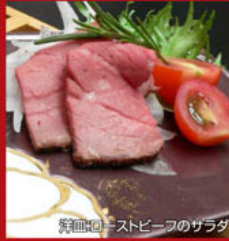
洋皿:ローストビーフのサラダ