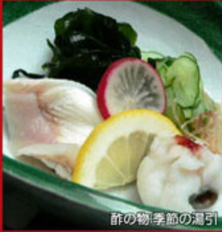
酢の物:季節の湯引